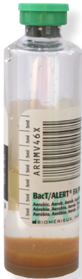
grüner Deckel = aerobe Kulturflasche