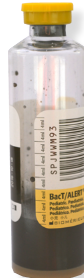
gelber Deckel = pädiatrische Kulturflasche