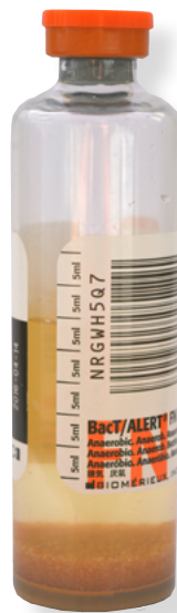
orangener Deckel = anaerobe Kulturflasche